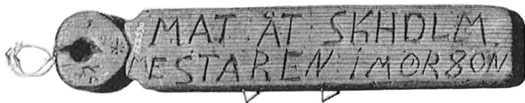
BILD 1. Matsticka som skickades runt bland de hushåll som hade att förse läraren med måltider.

Ett annat exempel på hur skolväsendet mobiliserade resurser i natura är organisationen och finansieringen av ambulatoriska skolor, vilka var tämligen vanliga i Sverige under 1800-talets andra hälft. Fortfarande vid sekelskiftet 1900 var 27 procent av de svenska folk- och småskolorna ambulatoriska. 51 Kring 1800-talets mitt var det sannolikt inte ovanligt att församlingsbor själva ansvarade för dessa skolors drift. Tryckta lärarminnen berättar om hur ambulatoriska lärare försågs med mat och husrum av församlingsbor, och hur sådana ofta tämligen informella arrangemang gavs ytterligare stadga genom så kallade skol- eller matstickor som markerade vem som skulle förse läraren med mat (se Bild 1). 52