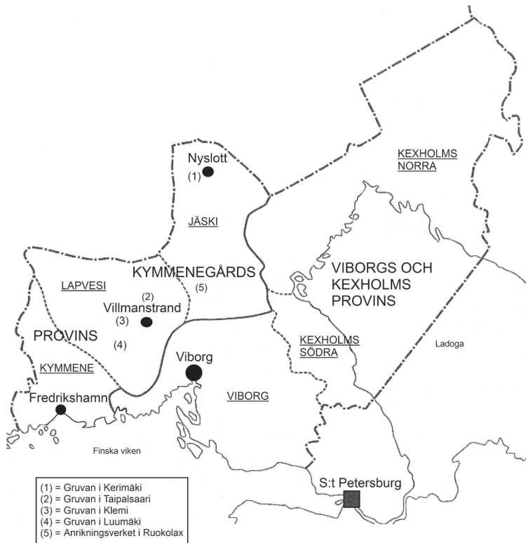
KARTA 1: Viborgs guvernement med provinser och härad samt blygruvorna [(1)–(4)] och anrikningsverket i Ruokolax (5) i Kymmenegårds provins