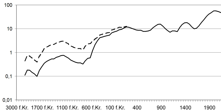
FIGUR 2. Taageperas kurva (fig. 1) över de tre största staternas utbredning, jämfört med en kurva för dessa staters ungefärliga faktiskt kontrollerade yta vilket är den nedre heldragna linjen, och en kurva för dessa staters ungefärliga inflytandeområde, vilket är den övre streckade linjen. Endast glidande medelvärde redovisas, efter 1500 före vår tideräkning omfattande 300 år, dessförinnan upp till 800 år.

Y-axeln anger miljoner kvadratkilometer.